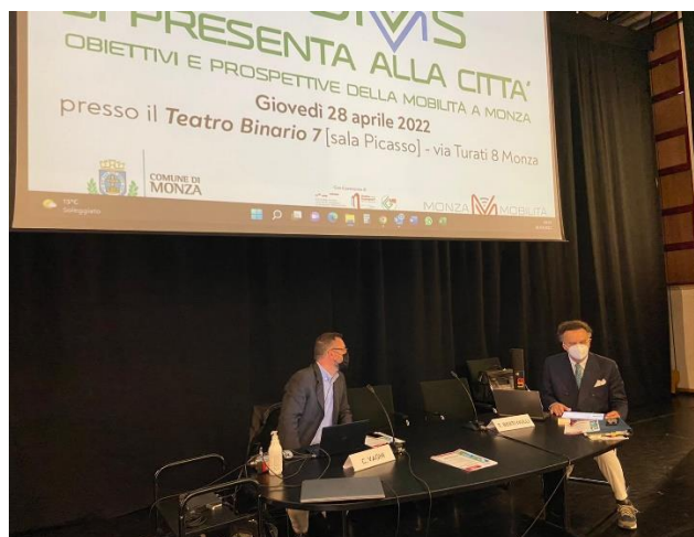
Laboratorio di mobilità urbana: registrazione dei partecipanti e organizzazione della plenaria introduttiva

Il World Cafè è strutturato in tre fasi: