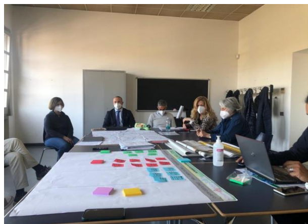
Lavoro in gruppo ai tavoli